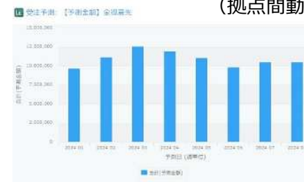
受注予測システム画面