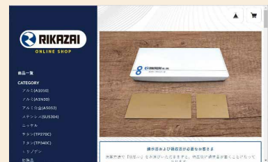
同社オンラインショップ

また、オンラインショップの開設により利便性がUPし、顧客満足度の向上につながるとともに、オンラインショップをカタログ的なイメージとして活用することにより、そこから問い合わせルートが拡大するなど、自社製品のPR効果の向上と拡大を実感しています。