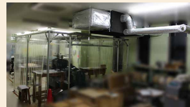
設置した局所給排気設備

圧延室に局所給排気設備を設置し換気を強化しました。その結果、溶剤の換気に要する待機時間がなくなったことで合計すると月約75時間の労働時間の削減を達成できました。