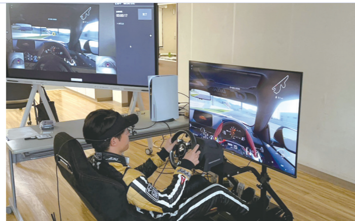
運転シミュレーターでの視線計測