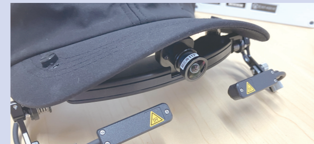
EMR-10「視野レンズ112°」の装着

限られた予算で最大限の効果を出すため、社内主導で教育資料を制作。重機作業や安全体感装置など、多様なシーンでの視線計測を実施しました。